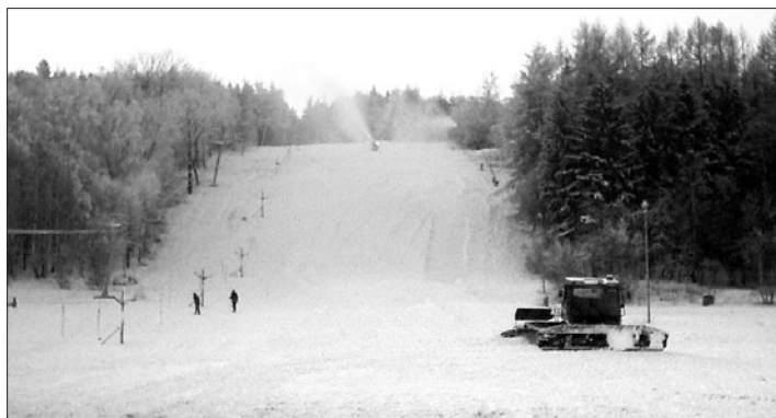
Lýžařský areál v Horním Podluží je v provozu od 29. 1. 2014 každý všední den od 10 do 20 hod., sobotu a neděli od 9 do 20 hodin